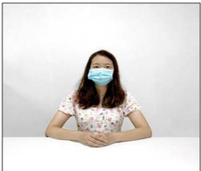
图2：正前方第一机位效果图