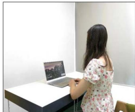
图3：侧后方第二机位效果图